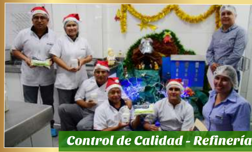
Control de Calidad - Refinería