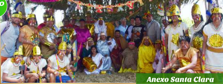
Anexo Santa Clara