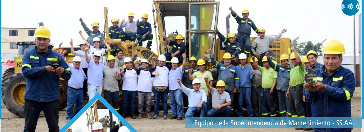
Equipo de la Superintendencia de Mantenimiento - SS.AA.