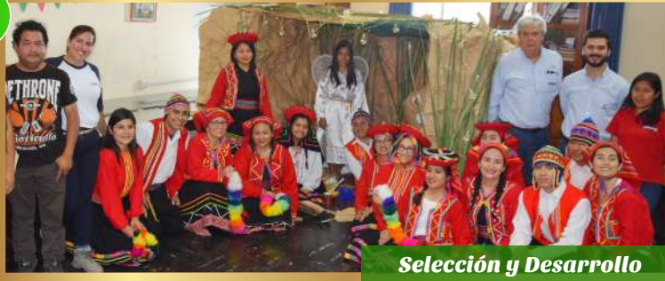
Selección y Desarrollo