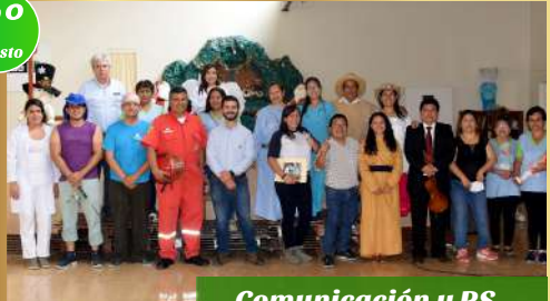
Comunicación y RS