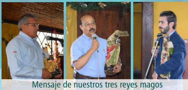
Mensaje de nuestros tres reyes magos

Con gran entusiasmo, nuestro líderes se reunieron para participar de un desayuno navideño, en el cual compartieron un tiempo de reflexión sobre esta importante fecha, además de momentos de camaradería y unión.