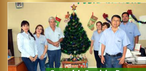
Control de Servicios Terceros