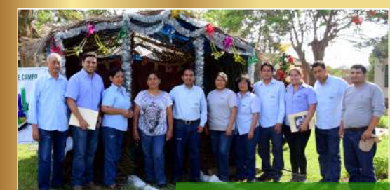
Gerencia de campo