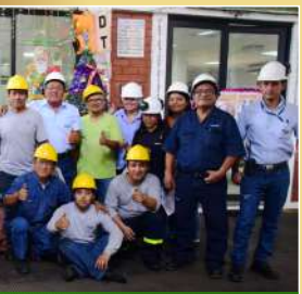
Laboración de azúcar